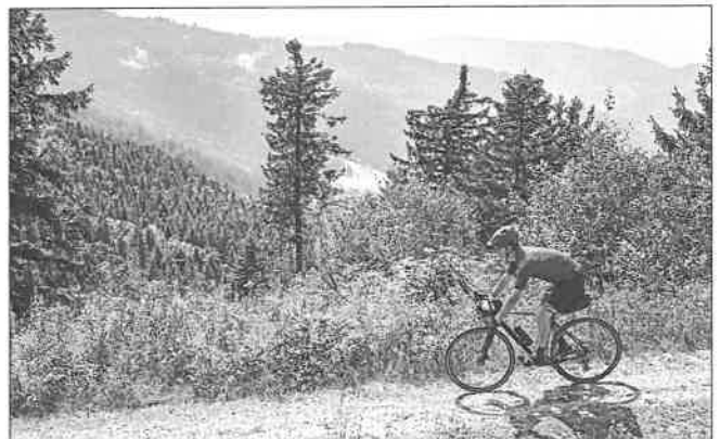
Zahlreiche gut ausgeschilderte Radrouten laden im Landkreis Freudenstadt zum Radeln ein