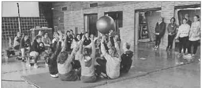
Fachkräfte aus den Kitas und dem Tageselternverein, sowie Übungsleiter verschiedener Vereine aus dem Landkreis Freudenstadt bei der 10. Zertifizierung zum Bewegungspass.

Weitere Informationen zum Bewegungspass in Baden-Württemberg unter: www.bewegungspass-bw.de