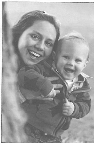
TEV LK Freudenstadt

Für viele Eltern ist die Kindertagespflege eine wichtige Betreuungsform. Das Angebot lässt sich flexibel gestalten und